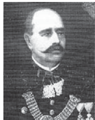
Aleksandar pl. Vučetić

nadbiskupa Mihalovića, kanonik zagrebački i doktor kanonskog prava. Poslije smrti nadbiskupa Mihalovića, ugarski ga je kralj imenovao zagrebačkim nadbiskupom, ali to imenovanje Sveta stolica nije potvrdila. U Hrvatskom je saboru vatreno zastupao Stranku unionista. Umro je u Karpinišu kod Temišvara 15. siječnja 1894. a pokopan je u Zagrebu.