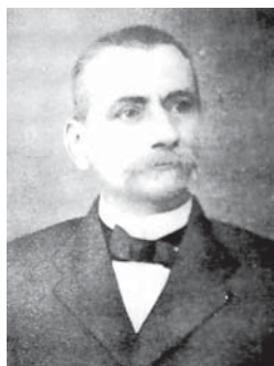
Književnik Josip Draženović

- Josip Draženović od Požrtve , rođen 1825. u Stajnici, austrougarski satnik, umro u 40-oj godini - 13. veljače 1865, sahranjen na stajničkom groblju.