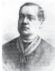
Dr. Stjepan pl. Vučetić

- Dr Stjepan pl. Vučetić "od Brinja i Cseneya" rođen 29. listopada 1836. U Cseneyu. Pučku je školu završio u Cseneyu, gimnaziju u Temišvaru, Aradu i Bečkereku, a teologiju u Csanadu i Beču, gdje je doktorirao. Za svećenika je zaređen 1859. godine. Bio je učitelj matematike i fizike u liceju u Temišvaru. Od 1866. do 1869. bio je mađarski zastupnik u Ugraskom saboru, a 1870. postao je tajnikom zagrebačkoga