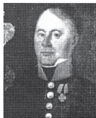
Potpukovnik Toma pl. Vučetić

- Potpukovnik Toma pl. Vučetić , rođen 1768. godine u Brinju a umro 1832. godine.