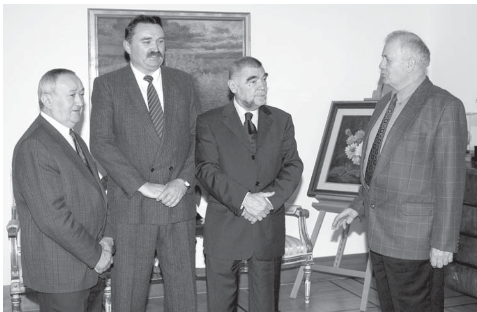
Predsjednik Stjepan Mesić (u sredini) i predstavnici Zavičajnog kluba "Stajnica" na prijemu u studenom 2003. godine

Najveći politički uspjeh doživljava 7. veljače 2000. godine kada je izabran za Predsjednika Republike Hrvatske, zbog čega istupa iz HNS-a, želeći biti predsjednikom svih građana Hrvatske.