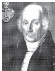
Mate pl. Vučetić

- Mate pl. Vučetić rođen 1769. godine u Brinju (ili Stajnici ?). Odgojio ga je naprijed navedeni stric Nikola. Otac Ilija bio mu je konjanički satnik koji je mlad poginuo u ratu s Turcima. Završio je gimnaziju u Vaszu, filozofiju na Kraljevskoj akademiji u Trnavi u Slovačkoj, a pravo u Požunu (danas Bratislava), te u Beču i Pešti. Doktorirao je pravo u Pešti 1790. godine i vodio katedru u Velikom Varadinu (danas grad Oradea u Rumunjskoj) i Košicama. Godine 1808. odlazi u Peštu, gdje na Pravnom fakultetu predaje rimsko, kazneno i privatno pravo. Poslije toga postaje dekan Pravnog fakulteta i rektor Sveučilišta Pazmany Peter u današnjoj Budimpešti. Napisao je nekoliko stručnih knjiga iz oblasti pravnih znanosti na latinskom jeziku. Spada među najveće hrvatske pravnike. Uvijek je isticao svoje hrvatsko podrijetlo i ponosio se njime. Borio se za hrvatske nacionalne interese u to vrlo složeno vrijeme.