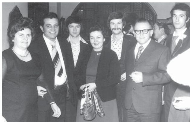
Stajničani u Osijeku

Godine 1679. dolazi do političkog iseljavanja Stajničana zbog sukoba s Vlasima. O tome detaljnije u poglavlju “Brinje u osmansko doba”.