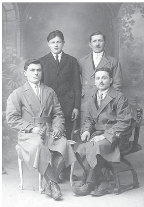
Skupina stajničkih radnika u Pittsburghu oko 1910. godine