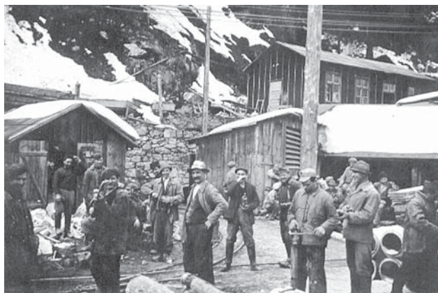
Linz, Austrija 1943. godine. Skupina naših radnika.

Drugi svjetski rat bio je posebno teško poglavlje u novijoj hrvatskoj povijesti. Hrvatska se opet našla u vrlo teškoj situaciji. Svi ljudi što su se tada pojavili na tadašnjoj jugoslavenskoj sceni svakodnevno su spominjani i na naslovnim stranicama američkih novina: Maček, Petar II., Tito, Pavelić i Mihailović imali su svoje pristaše i protivnike u Sjedinjenim Državama. Najne-