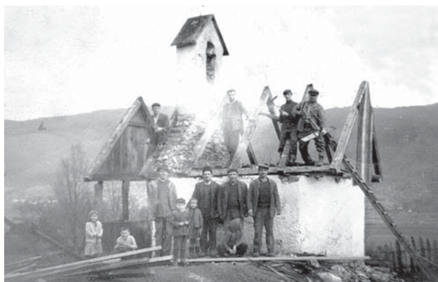
Zamjena krova na kapelici sv. Marije Magdalene na Brdu

Ima jedan vrlo zanimljiv događaj kojega treba spasiti od zaborava. Pred crkvom u Jezeranama nalazila se do Drugog svjetskog rata kapelica Svetog Jurja. Jezeranci su poslije prvog svjetskog rata naručili dva zvona za svoju crkvu. Pošto su odustali od postave zvona na kapelicu, manje su poklonili kapelici Svetog Petra u Stajnici, gdje se i sada nalazi!