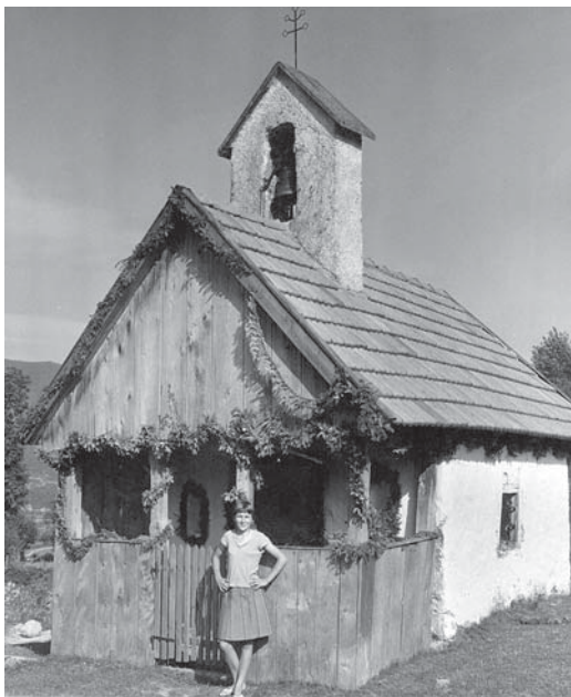
Stara kapelica sv. Marije Magdalene na Brdu, šezdesetih godina prošlog stoljeća

Stajnički župnici odigrali su veliku ulogu u prosvjećivanju i dušobrižništvu, ali i održanju nacionalne samobitnosti ljudi ovoga kraja. Oni su imali i veliki utjecaj na svjetovnu vlast. U vrijeme velike nepismenosti i zaostalosti svećenik uz pastirsku službu i dušobrižništvo imao