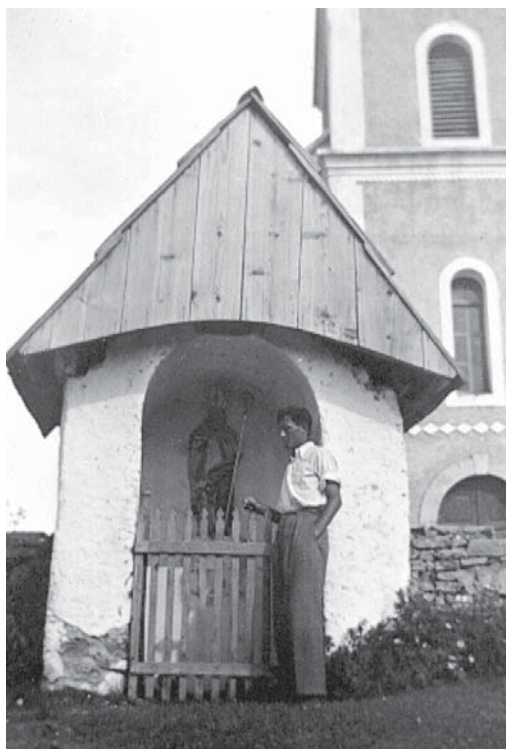
Kapelica Sv. Nikole ispred Župne crkve prije Drugog svjetskog rata