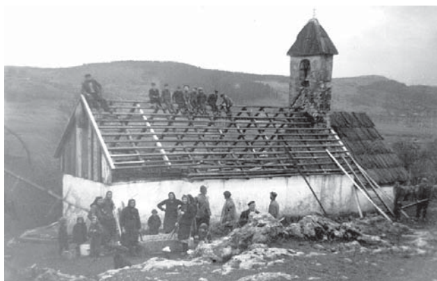
Zamjena krova na kapelici Sv. Petra