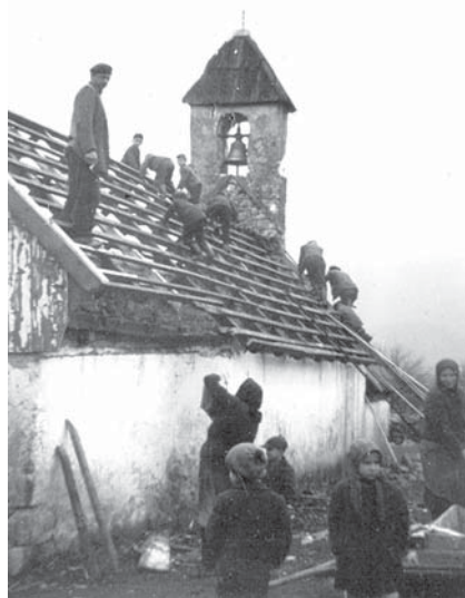
Zamjena krova na kapelici Sv. Petra