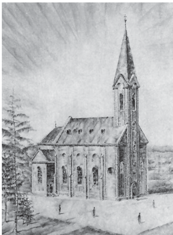
Projekt nove crkve u Stajnici