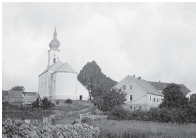
Crkva u Jezeranama prije Drugog svjetskog rata