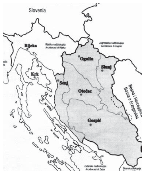
Gospičko-senjska biskupija danas

Nestala je pisanih tra- gova ali i materijalnih osta- taka te crkve. Prema mišlje- nju arheologa današnja kapelica Sv. Petra potječe iz srednjeg vijeka, međutim u vojnim katastarskim kar- tama iz 1780. nje tamo ne- ma! Da li se u to vrijeme na- lazi u ruševnom stanju, te je kasnije obnovljena - teško je utvrditi. Turska su pusto- šenja uništila sve tragove i prekinule kontinuitet broj- nih srednjovjekovnih nase- lja na ovim područjima.