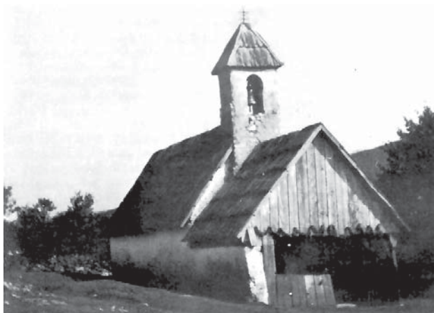
Kapela Sv. Petra i Pavla 1943. godine

Područje se i nadalje naseljava i broj stanovnika raste. Stajnička naselja zbog kvalitetnih livada i oranica, ali i tekuće vode postaju privlačna za naseljavanje i razvoj naselja. Zbog napućenosti brinjskog područja i njegove prostranosti u udaljenim filijalama postojali su vikarijati u kojima su vikari stalno boravili i vodili duhovnu pastvu u ovisnosti o brinjskom župniku. Godine 1733. uz župnika u Brinju postoje joštri svećenika. Jedan od njih stanuje kod filijale sv. Mihovila u Dabru, a drugi je u Stajnici i tamo posjeduje stan. Zasigurno se tamo nalazi negdje od 1730. (M. Bogović, Vila Velebita, 1994). Prema nekim pisanim podacima stajnička kapelanija (filijala brinjske župe) počela je djelovati 1737. godine. Nju je posjetio 27. lipnja iste godine biskup Benzon i tom je prilikom posvetio