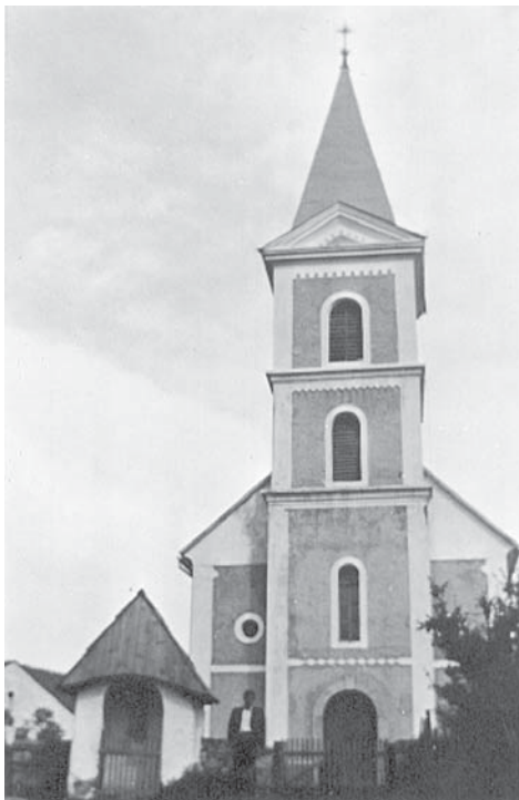
Stajnička župna crkva Sv. Nikole prije Drugog svjetskog rata

U novu domovinu Hrvati dolaze kao pogani s vjerom u mnoštvo bogova i u moć prirodnih sila- religije koju su baštinili na izvorima indoeuropske civilizacije. Početak pokršćavanja započelo je nedugo nakon doseljavanja - početkom 7. st (610.-641.). Katolička vjera počela se najprije širiti među Hrvatima iz bizantskih gradova na Jadranu, iz Rima, ali i posredstvom misionara iz franačkih središta, posebice iz Akvileje. Pod utjecajem rimskih starosjedilaca, pa onda pape Ivana IV. Dalmatinca i bizantskog cara Heraklija , koji je doveo svećenike iz Rima, Hrvati su počeli primati kršćanstvo. Proces pokršćavanja trajao je nekoliko stoljeća. Običan puk teško se odvajao od starih religijskih tradicija. Stanovništvo ovoga kraja prešlo je na kršćanstvo tijekom drugog pokršćavanja, između 867.-886. pa možda i u desetom stoljeću.