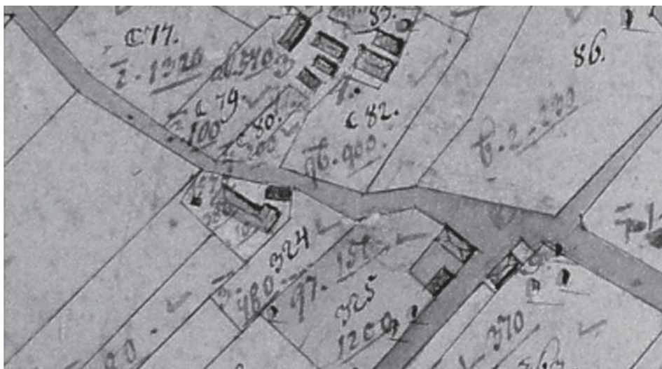
Stara kapelica, toranj sa zapadne strane i sadašnja župna crkava u gradnji. Stanje između 1780. i 1820. godine (HDA, zbirka karata)

Župna crkva evidentirana je u spomeničkoj baštini kao kulturno dobro. Izgrađena je od kamena u formi prostranije kasnobarokne crkve. Smještena je uz groblje, pravilno orijentirana i ograđena cinkturom. Jednobrodna je, pravokutnog tlocrta s izduženim poligonalnim svetištem, sakristijom smještenom sjeverno uz svetište i zvonikom iznad glavnog pročelja. Lađa je svodena bačvastim svodom s eliptičnim presjekom a svetište bačvastim svodom, dok je zaključak svetišta riješen polukatom. Lađa je osvijetljena s po tri polukružna izdužena prozora. U njoj je djelomično sačuvan barokni inventar. Na glavnom oltaru postoje kipovi i pala svetog Nikole.