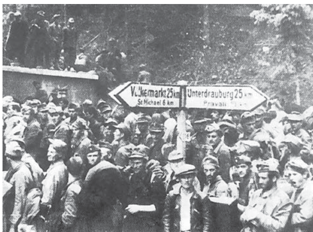
Bleiburško polje 1945. godine

Kaže se da je osvetna pobjednika nad pobijedjenim sastavni dio pobjede. Blajburška tragedija jedna je od najvećih tragedija hrvatskog naroda. Dogodila se nakon prestanka vojnih operacija i potpisivanja primirja. Dakle, radi se o ratnom zločinu definiranom odredbama međunarodnog ratnog prava. O tome su napisane brojne knjige i članci. Da li se radilo o “ čišćenju palube ” kako su to naveli Englezi ili je najbliža istini izjava visokog partizanskog funkcionara Milovana