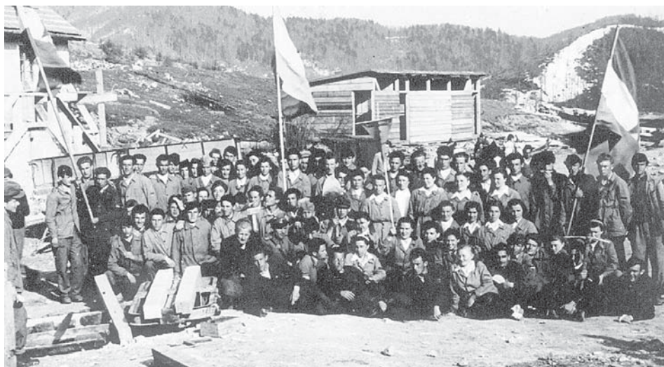
Omladinske radne akcije

Započeta je izgradnja zadružnog doma u Stajnici, koji je poslije prenamijenjen za školu. Gradi se nova školska zgrada na Brigu, koja će biti nazvana Osnovna škola Tominac Draga . Sva su stajnička domaćinstva dobila obveze u radu i osiguranju građevinskog materijala tijekom gradnje ovog objekta. Najviše je ljudi angažirano na dopremi melte (pijeska) iz Osrečiča , kamena, paljenju kreča, izradi i prijevozu građe i slično. Zidari su bili iz Primorja, jer na području Stajnice nije bilo dovoljno ove struke.