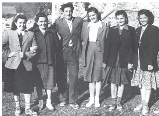
Skupina mladih Stajničana pedesetih godina prošlog stoljeća