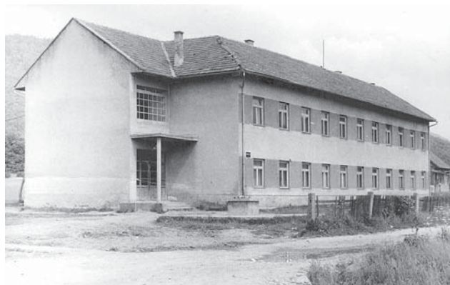
Nova školska zgrada otvorena 1963., a zatvorena 1991. godine

Omladina odlazi na omladinske radne akcije širom Jugoslavije. Najviše ih radi u Novom Beogradu na gradnji zgrada i infrastrukture, a neki odlaze i na prugu Šamac - Sarajevo i