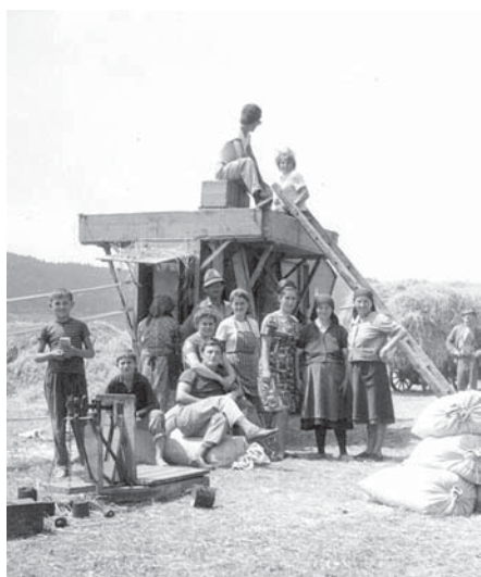
Vršenje žita na treš