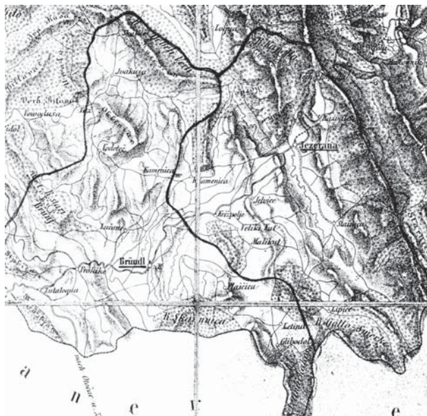
Područje Jezeranske satnije

Iscrpno i pouzdano izvješće o Karlovačkom generalatu načinio je 1835. godine Franz Julije Fras . Pošto se radi o jednom izuzetnom djelu koje analizira stanje Stajnice i okoline iz prve polovice 19. stoljeća, ovdje donosimo detaljne izvode iz njegove knjige. Stajnica se tada nalazi u sastavu Ogulinske pukovnije i Jezeranske kumpanije. Svaka kumpanija imala je svoj broj i zonu odgovornosti. Kakvo je brojno stanje i sastav stanovništva, površina poljoprivrednog zemljišta i broj crkava bio u to vrijeme na širem području: