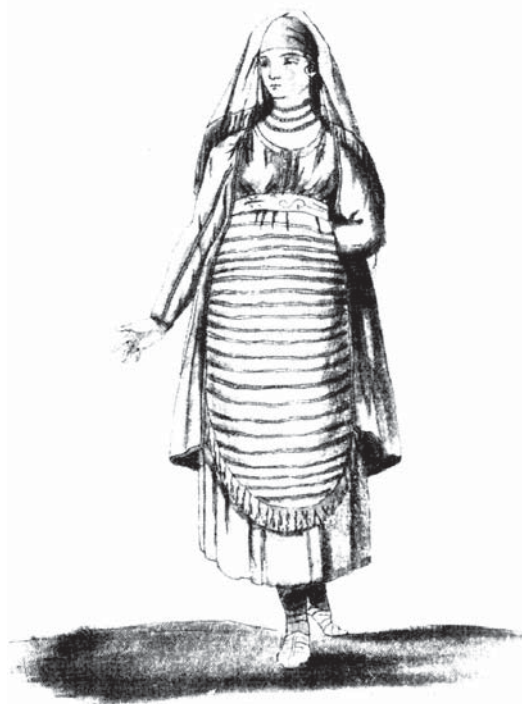
Ličanka sredinom XVIII. stoljeća

Odnos muškarca prema ženi također je bio nehuman i ponižavajući. Nikad je nije časnو imenovao, već bi rekao «da prostitute, moja žena» . Žene su često sa svojim muževima išle na položaje prilikom nenadanih turskih provala. Zasigurno su gubici uslijed toga bili dosta veliki. Velike neprilike pričinjavale su razne turske skupine, koje bi nenadano napadale naše vojnike i ostali živalj. U takvim slučajevima vodila se ogorčena borba na život i smrt. Naši preci nisu htjeli živi pasti u zarobljeništvo, već bi radije odabrali smrt!