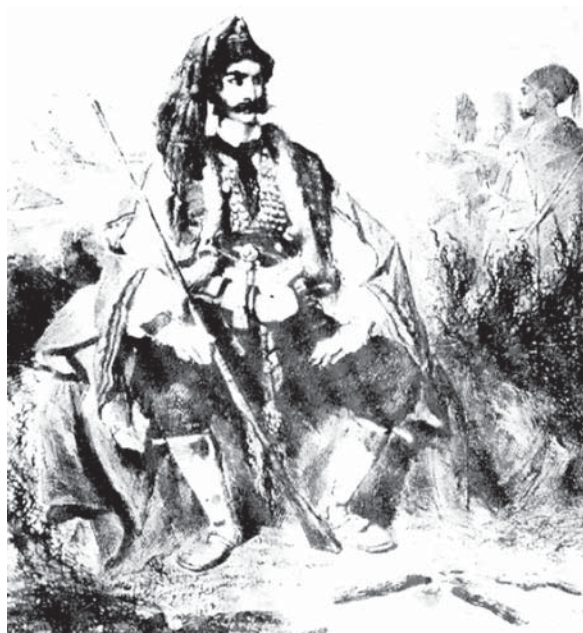
Vojnik u vrijeme oslobođenja Like i Krbave