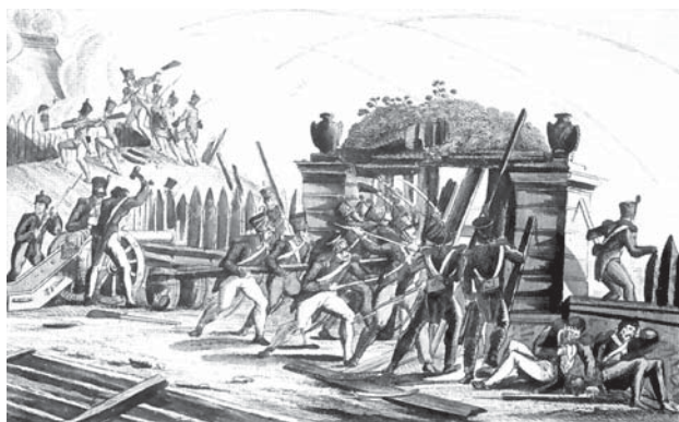
Ogulinska regimenta u Zadru 1813. godine.

rekonstruirati cestu od Karlovca do Senja, koju završava 1843. godine. Veliki broj Stajničana radi na njezinoj gradnji (Vidi: Izgradnja prometnica ).