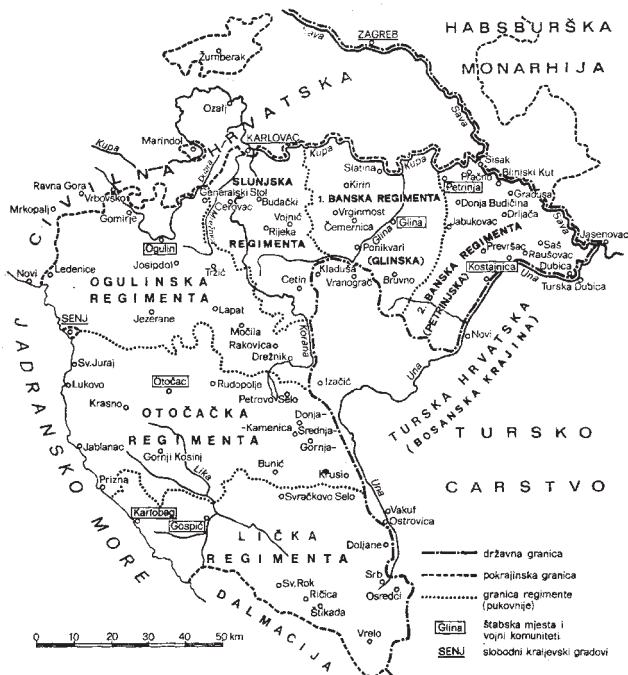
Vojna Hrvatska

U Karlovcu je osnovana trupna škola za lokalne mladiće, uglavnom djecu časnika gdje su uz ostalo, učili i strane jezike, prije svega francuski, talijanski i latinski. Nadareni mladići odlazili su u časničke i dočasničke škole u Francusku. Prema vojnim evidencijama iz 1811. u tadašnjim francuskim regimentama susrećemo dva časnika s prezimenom Božičković , tri sa