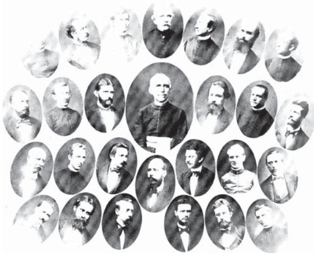
Dr. Matija Mesić prvi rektor Zagrebačkog sveučilišta (u sredini)

Mažuranićeva vlada daje poseban prioritet razvoju školstva. Zagreb dobiva sveučilište s tri fakulteta, čiji je prvi rektor dr Matija Mesić , Brođanin, brinjskih korijena ( vidi: Povijest crkve ). Treba napomenuti da oko 1860-ih opet oživljavaju ideje ilirizma, sada pod drugim imenom - južnoslovenskim ili jugoslavenskim. Glavni predlagачi jugoslovenstva su biskup Strossmayer i kanonik Rački, vodeći povjesničar i prvi predsjednik Jugoslavenske akademije znanosti i umjetnosti. Njihova su nastojanja prvenstveno bila kulturna, iz razloga što su bili svjesni da Hrvati nemaju dovoljno potrebnih sredstava za otpor austro-ugarskim denacionalizatorskim nastojanjima, te da se zbog toga moraju osloniti na svoje slavenske srodnike na Balkanu i drugdje. Cilj im je bio duhovno ujedinjenje Južnih Slavena, utemeljeno na zajedničkoj kulturi i književnom jeziku. Financiraju različite kulturne ustanove, koje imaju svrhu da izvuku Hrvate iz njihove provincijske zatvorenosti i da ih izloži suvremenim europskim kulturnim strujanjima. Jugoslavenska akademija, Hrvatsko sveučilište u Zagrebu