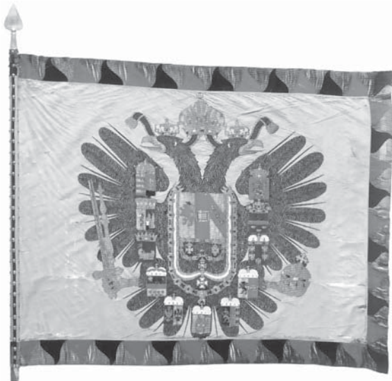
Vojna zastava Ogulinske pukovnije

Reorganizacijom vojske iz godine 1860. u svim krajiškim regimentama uvodi se dodatno jedan odred šerežana za unutrašnju redarsku službu ( Valentić, Vojna krajina... ). Vojnički sustav u Krajini zasnivao se na satniji, od koje, u pravilu, kreće svaki korak u nekom poslu. Satnija je bila ne samo vojnička, već i upravna i sudbena jedinica. Sva se lokalna vlast nalazila u zapovjedništvu satnije, koje se dijelilo na vojničko i vojničko-upravno osoblje. U zadružnim i drugim civilnim raspravama sudio je kapetan pomoću tzv. seksija koje su se sastojale od nekoliko seoskih starješina ( Dujmović, str. 72 ). Kapetan je bio ovlašten suditi na kazne koje su se izvršavale u satniji, na “rešt” ili “batine”. Zanimljive su bile kazne batinanjem, odnosno trčanja “ kroz šibe ”. Na šibe osuđeni vojnici morao je trčati kroz dva reda postrojenih vojnika. U redove je bilo postrojeno do 300 vojnika, postrojenih jedni nasuprot drugih, svaki s brezovom šibom u ruci. Kažnjenik je golih leđa do pojasa na zapovijed morao brzo trčati. Svaki vojnici ga je šibom po leđima morao udariti, ako nije dobio bi batine. Trčanje se obavljalo onoliko puta na koliko je osuđenik osuđen. Dvanaest trčanja bila je gotovo smrtna kazna. Poslije prvog trčanja leđa osuđenika bila bi modra, poslije drugog krvava, a poslije trećeg i četvrtog otpadali bi komadi kože i mesa. Često bi zbog toga okrivljenima, ali i vojnicima u redovima pozlilo.