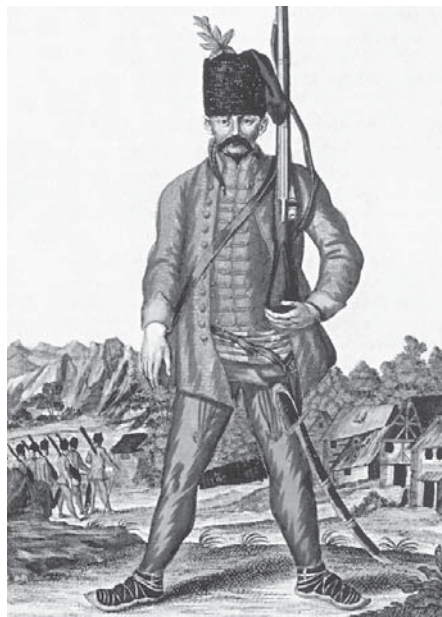
Vojnik Ogulinske pukovnije (regimente)

topništvo i specijalni strijelci kao novi rod vojske. Godine 1765. od Otočke pukovnije odvajaju se i pripajaju Ogulinskoj pukovniji mjesta: Krmpote, Ledenice, Brinje, Krivi Put, Jezerane, Stajnica, Križpolje, Prokike i Vodoteč. Stajnica je pripadala pod treću satniju-kumpaniju, čije je zapovjedništvo bilo u Jezeranama. Tada su u Stajnici stalno boravila dva krajiška časnika (poručnik i natporučnik). U njoj je bio i vojnički magazin kod današnjeg Dvora, koji se sastojao od tri velike zgrade. U njima se čuvala hrana za graničare i vojna oprema. Godine 1769. uveden je njemački vježbovnik.