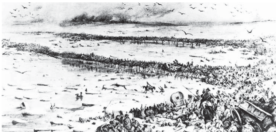
Povlačenje Napoleonove vojske iz Rusije

spominje se poručnik Ivan Sertić . Prije toga sudjeluju u bici kod Lützena (2. svibnja), i u sukobu s pruskim ustanicima kod Radenburga (Dresden-13. svibnja). Postoje vrlo oskudni podaci o sudbini krajišnika u ovom pohodu. O tome nešto više u dijelu knjige «Ratovi širom Europe» .