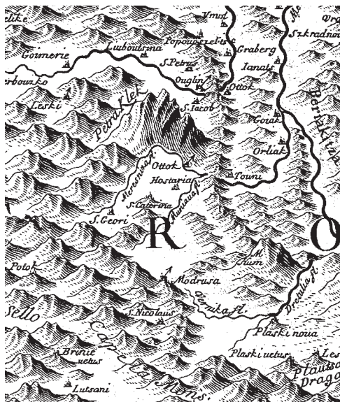
Zemljovid sjeverne Like i ogulinskog područja

Petar je u to vrijeme imao značajnih uspjeha u borbi s Turcima. Cilj mu je što prije osloboditi posjede pod turskom vlašću, zbog čega je zagovarao ustrojavanje stalne hrvatske