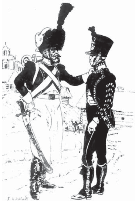
Krajišnici u francuskoj vojsci

Međutim, krajišnici, koji su najvećim dijelom bili Hrvati, bili su u vrlo lošim, neprijateljskim odnosima s Crnogorcima, tako da do pada nije došlo. Gradske ključeve predali su povjereniku austrijske vlade, zaključujući da će Francuzi uskoro doživjeti krah, što se na koncu i obistinilo.