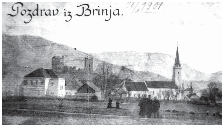
Brinje početkom XX. stoljeća