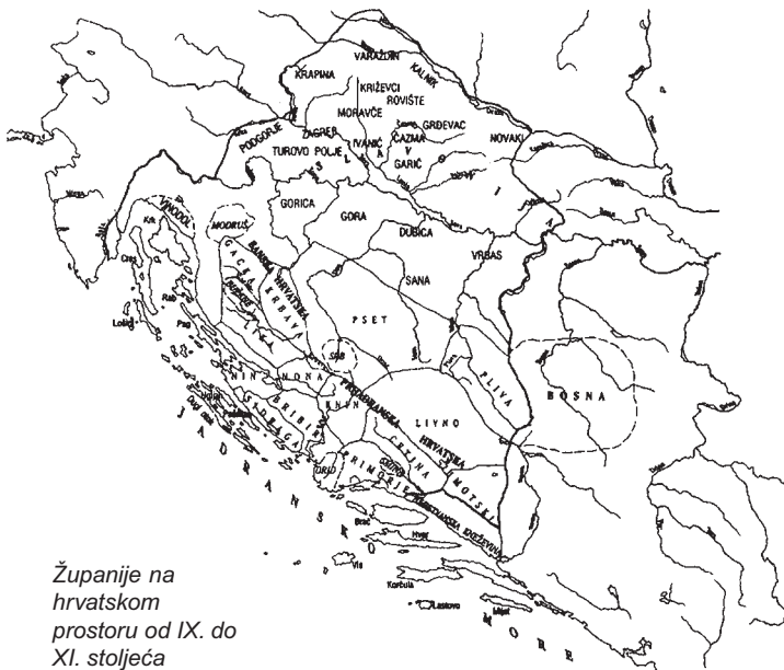
Županije na hrvatskom prostoru od IX. do XI. stoljeća

U sklopu složenih procesa preobražaja rodovskoga u feudalno društvo mijenjalo se i teritorijalno ustrojstvo. Između sredine 10. i 11. stoljeća i ovdje se učvrstila feudalna teritorijalno-politička organizacija. Od kraja 11. st. razvoj feudalne organizacije odvijao se pod utjecajem Ugarske, dok su županije osnovane tek krajem 12. i početkom 13. stoljeća. Kakva je bila niža organizacija društvenog ustroja toga vremena? Staro pleme Gačana dijelilo se u to vrijeme na rodove - zajednice šireg krvnog srodstva, na čelu s glavarima . Rodovi su se pak dijelili na zadruga - zajednice užeg krvnog srodstva, na čelu s gospodarima . Treba napomenuti da u prvim stoljećima Hrvatske države tadašnje društvo ne poznaje pojedinačno vlasništvo nad zemljom, već se cijelo područje župe, sa svim prirodnim bogatstvima, smatralo zajedničkim zadrugnim vlasništvom. Temeljna im je privredna djelatnost bila ratarstvo i stočarstvo - uzgoj ovaca, koza, svinja, goveda i konja. Poseban je značaj konjogojstva u opskrbi vojske. Od novih poljodjelskih kultura Hrvati preuzimaju vinogradarstvo, koje se uspješno gajilo zbog tada povoljne klime (Lopašić, Dva