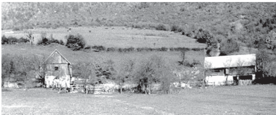
Ostaci japodskog naselja u Tominčevoj Dragi iznad Pešića

Bakreno doba (eneolitik) je vrijeme prvih većih migracija stanovništva, odnosno prodora prvih Indoeuroljana na istočni i središnji Balkan. Oni donose nove elemente materijalne i