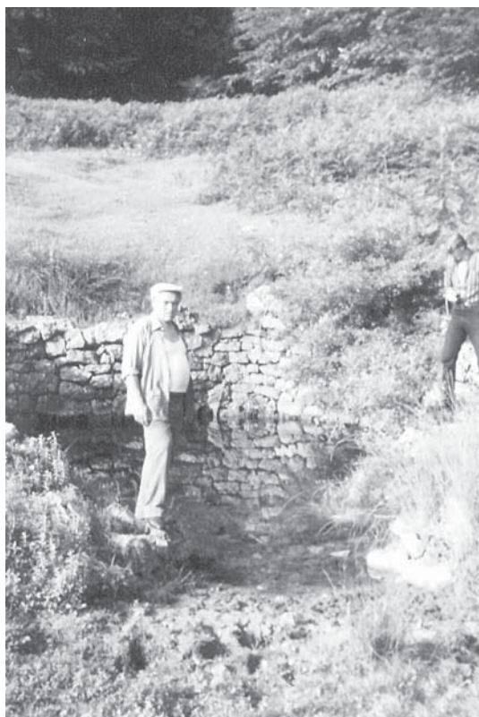
Ostaci nepoznatih prapovijesnih graditelja - Živa voda na Kapeli