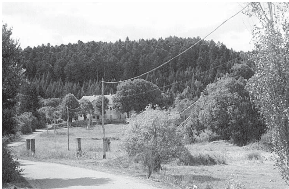
Južna strana stajničkog polja obilovala je japodskim naseljima. Šuma iznad Dvora.